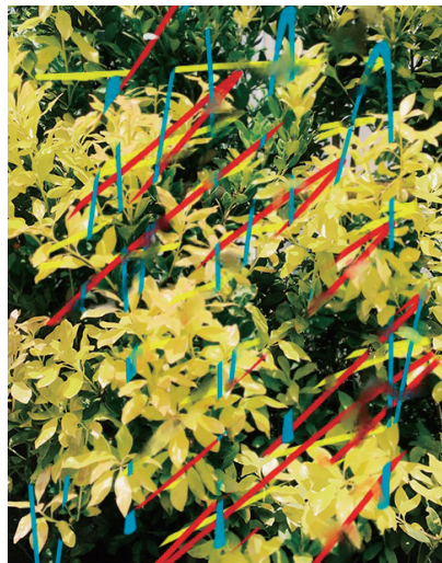
FIG CAM - FIG OUT ver. | 2019 フォトグラファー広光 (un) による撮り下ろし作品と来場者のポートレートを合成し、多重露光のようなイメージを生成するフォトコンテンツ。