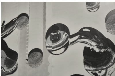
E-FRAMES | 2018 紙の長所とされる視認性を保ちながら、表示内容を電氣的に書き換えられる「電子ペーパー」を用いた作品。