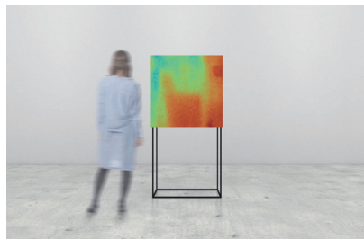
Material Vision - Prototype 2 | 2019 温度で色の変わるインクを表面に塗装し、背面から温度制御することで様々な色を映し出すプロトタイプ作品。